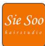
Sie Soo Hairstudio