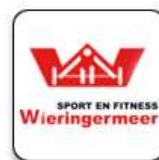
Sport & Fitness Wieringermeer