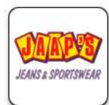
Jaaps Jeans en Sportwear