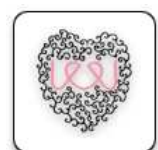
jeej baby en kinderkleding